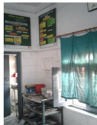
Nurse Mentor –Skill Lab in PHC Chamraua