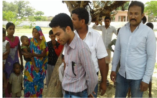
RBSK Team Logistics at AWC – Chakarpur Kadeem CHC Shahabad