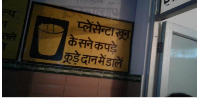
Bad Practice of BMW & IP near Patient Care Ward at DWH Rampur