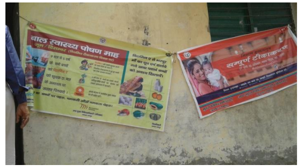
BSPM & RI Banner at Session Site Chidiya A/W Center