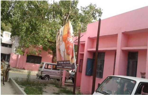
Mission Indra Dhanush –Hoarding at CHC Milak