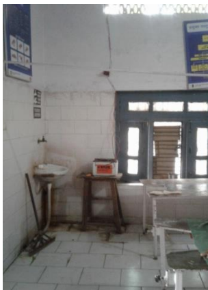
Nurse Mentor –Skill Lab in PHC Chamraua