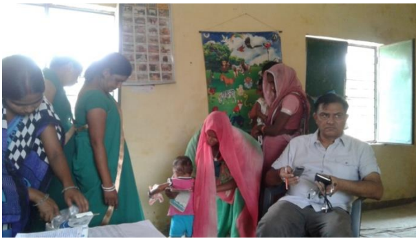
Mission Indra Dhanush Session site Chidiya A/W Center