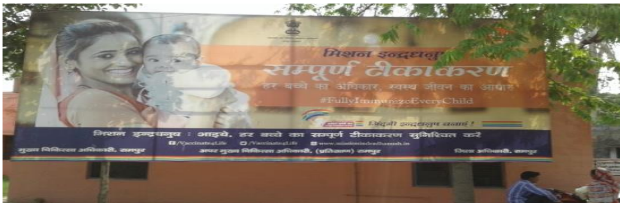
Mission Indra Dhanush –Hoarding at PHC Chamraua