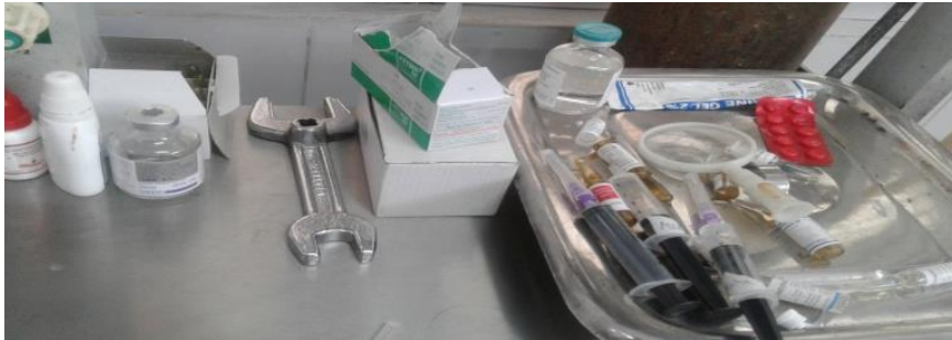
Bad Practice of IP in DWH Nursing Station

भ्रमण करने वाले अधिकारियों के हस्ताक्षर—