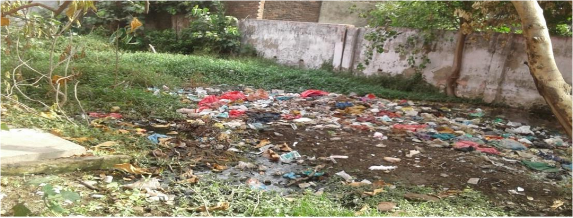
Garbage Near Labour Room at CHC-Milak