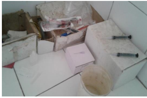
Infection Control & BMW protocol is not followed in DWH