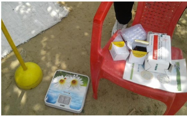
RBSK Team at AWC –Chakarpur Kadeem CHC Shahabad