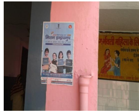
Mission Indra Dhanush –Poster at CHC Shahabad (Hoarding not available at the time)