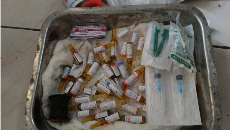
लेबर रूम मे रखी ट्रे