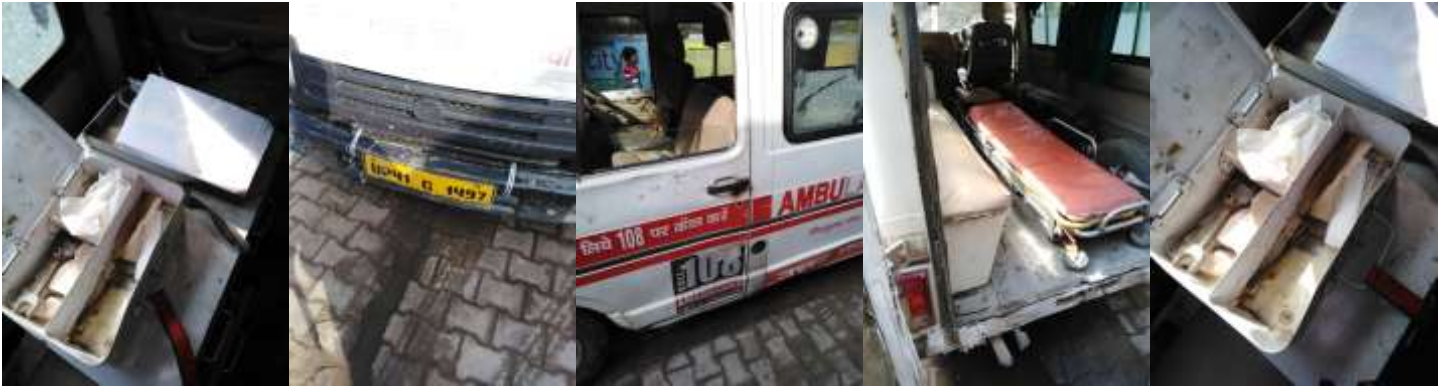
यू.एच.एन.डी. - जन सेवा अस्पताल मो0 बक्सरिया