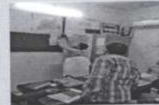
CHC Saroorpur Khurd