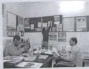
Urban PHC Naglabattu